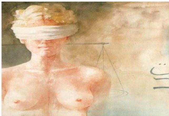
Figura 4: Berenice