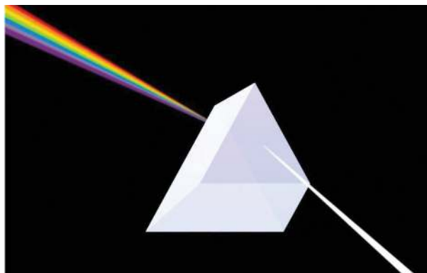
Figura 1: Dispersão de feixe de luz branca através de um prisma