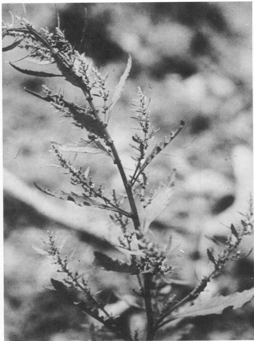
Fig. 1— Erva-de-santa-maria ( Chenopodium ambrosioides Linné): aspecto do ramo flórfero e frutificado.