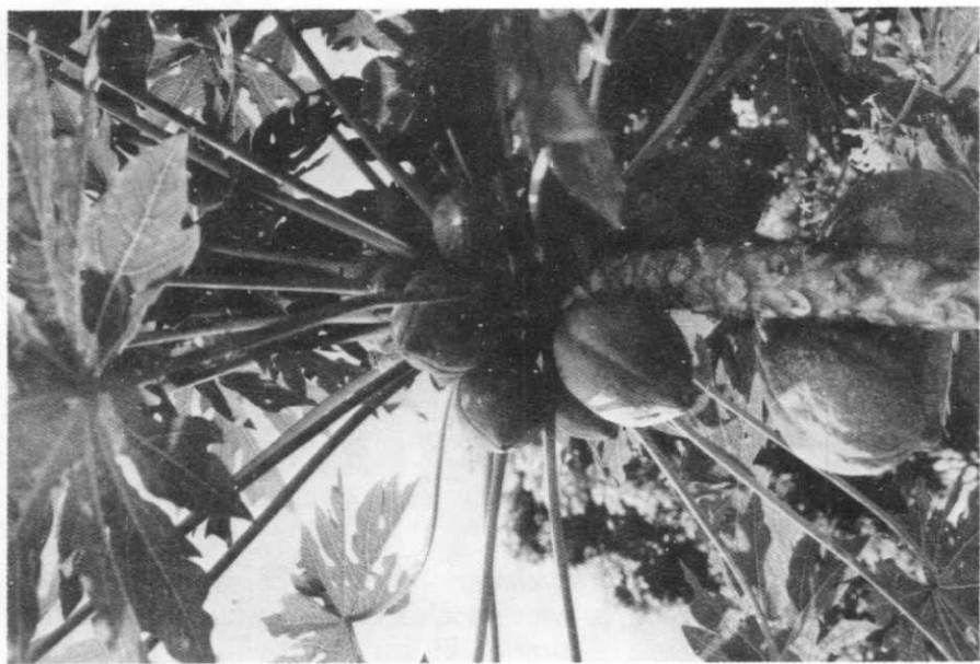
Fig. 2 — Mamoeiro ( Carica papaya Linné): planta feminina.