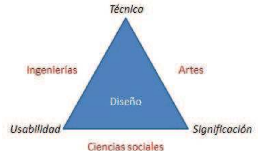
Figura 1 – Fronteras epistémicas del diseño

El diseño industrial interviene en tres dimensiones cruciales de los productos industriales: la técnica, la usabilidad y la significación. Por ello, se ubica en un espacio epistémico lindante con la ingeniería (ubicada entre la técnica y la usabilidad), las artes (técnica y significación) y las ciencias sociales (usabilidad y significación). Esta actividad hace las veces de interfase entre la tecnología y la vida cotidiana: si bien comparte con las ingenierías la preocupación por las metas técnicas, lo hace reformulándolas de modo de alcanzar resultados sociotécnicos: articula simbologías, rituales y creencias, así como determinados sistemas de preferencia referidos al lenguaje, a la comprensión y a la percepción de los objetos (LEIRO, 2006).