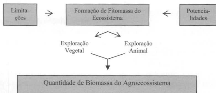
Figura 4 – Representação esquemática da obtenção de biomassa em um agroecossistema vegetal e/ou animal, a partir das limitações e potencialidades da formação de fitomassa de um ecossistema.

Ao intervir num ecossistema, o homem busca obter biomassa para o suprimento de sua necessidade de alimentação ou de matéria-prima, substituindo as plantas e/ou animais das comunidades naturais por outras ou outros que lhe são úteis: isto é, transforma o ecossistema em agroecossistema. Entretanto, independentemente do tipo de exploração, vegetal e/ou animal, a quantidade de biomassa a ser obtida em um ecossistema dependerá das limitações e potencialidades da radiação solar, água e nutrientes para a realização dos processos fisiológicos das plantas. Em outras palavras, a quantidade de biomassa, vegetal ou animal, obtida, dependerá das limitações e potencialidades da formação de fitomassa do ecossistema que se quer transformar em agroecossistema (Figura 4).