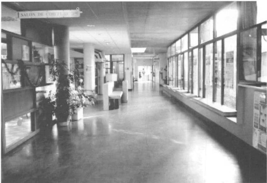
Hall de entrada do Village. À esquerda o cabelereiro, em seguida a boutique (toldo listrado) e a biblioteca. Ao fundo, o corredor para uma das alas. À direita, janelas para o jardim interno e, no final, virando mais ainda à direita chega-se à cafeteria.