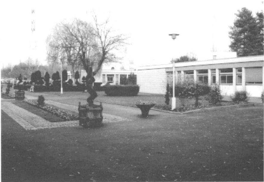
Jardim e entrada principal. À direita, em primeiro plano, o prédio da direção.