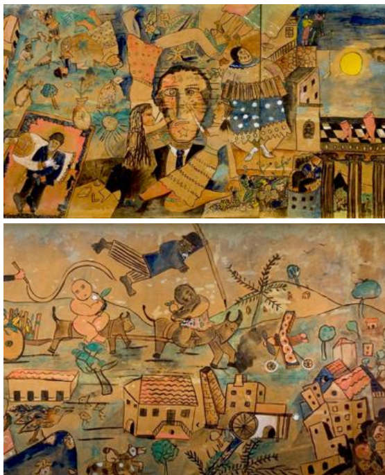
FIGURAS 3 e 4 - Pintura modernista do artista pernambucano Cícero Dias com 13mx2m, feito em papel kraft. Eu vi o mundo... Ele começava no Recife... Ambas as imagens pertencem ao mesmo quadro.

Para exemplificamos mais essas interpretações visuais, como referência de captura do pensamento do ser moderno, há na obra Eu vi o mundo... Ele começava no Recife (1929), do artista plástico Cícero Dias (1907-2003). Como mostram as figuras 3 e 4, em pleno período modernista do Brasil, ele apresentou uma pintura da paisagem urbana da cidade repleta de tipos humanos e cada um com uma história diferente a ser contada, sob 24 visibilidades canônicas, mas em contraponto, também, invisibilidades que foram escancaradas na obra e que provocaram indignação na sociedade patriarcal do país na década de 1920.