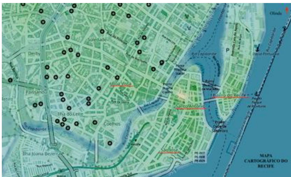
FIGURA 12 - Mapa topográfico do Recife 2023. Desenho dos bairros principais da região central do Recife. Acesso em 21.02.2025.

Vemos na Figura 12 67 os principais bairros centrais do Recife que passaram pelas transformações urbanas em larga escala: Bairro da Boa Vista, Bairro de São José, Bairro de Santo Antônio, Bairro do Recife, por onde circulava a maior parte da população no século XIX. Esse caminho fluvial é até hoje um rizoma para as relações na paisagem urbana. Ele perpassa as entranhas da cidade encontrando com o mar no final dele, onde ela nasce através do porto.