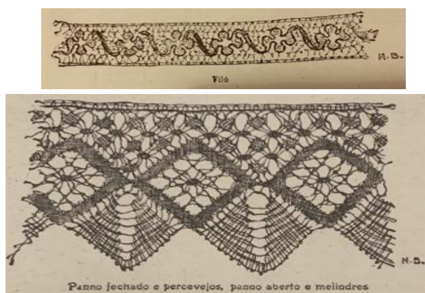
FIGURAS 10 e 11 - Rendas desenhadas em bico de pena na década de 1920 por Manoel Bandeira, artista pernambucano. Essas imagens foram publicadas no Livro do Nordeste , organizado pelo sociólogo Gilberto Freyre. Os traçados dos ornamentos de ferro se basearam nas rendas já existentes, segundo pesquisas de Freyre.

Um destaque dentro da perspectiva da visualidade da modernização da paisagem foi a importância da chegada em Pernambuco (via Inglaterra) do ferro e do vidro no século XIX. Vale salientar que o ferro rendilhado vira produto “tipicamente brasileiro” 55 , quanto ao tipo do design oferecido, pois se baseando nos muxarabis 56 mouros e nas rendas de tecido artesanais (Figuras 10 e 11), transformou-se num ornamento admirado para uso em casas e foi largamente procurado para a estética de seus portões, grades e varandas em Pernambuco.