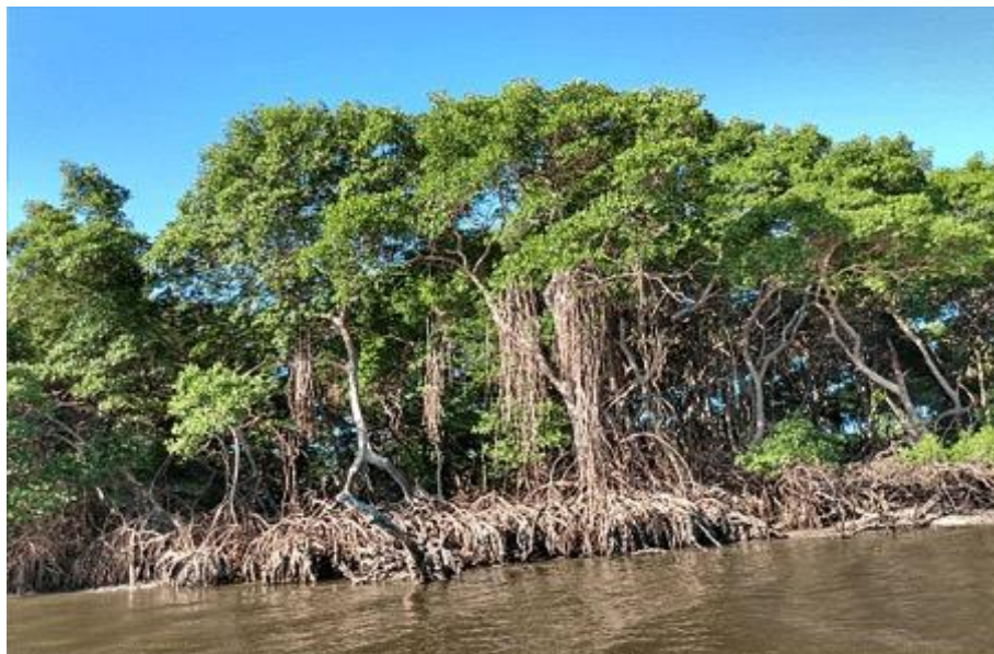
FIGURA 2 - Fotografia das árvores mangue no terreno do manguezal em Recife.

Os mocambos citados por Freyre ocupavam as margens do mangue. Aquela planta que vemos hoje se entranhava com suas garras no rio e abrigava caranguejos, preenchendo a vista da cidade e das pontes centrais do Recife, marcando os traços da fachada de forma sistêmica.