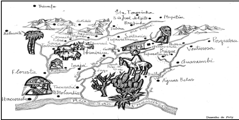
Figura 8 – Sertão das Três Ribeiras

Fonte: LAZZAROTTO, Napoleon Potyguara. Desenho . 12