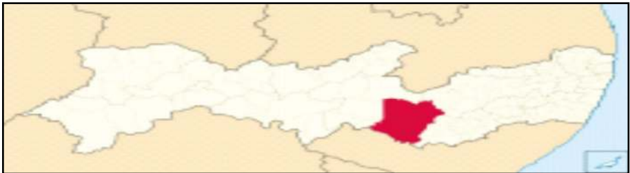
Figura 4 – Microrregião do Ipanema pernambucano

Pela região do Ipanema ocupa uma área de 5.274 km 2 , possui clima semiárido, chuvas escassas e mal distribuídas, altas temperaturas e é formada por 6 municípios: Águas Belas, Buíque, Itaíba, Pedra, Tupanatinga e Venturosa, conforme figura abaixo: