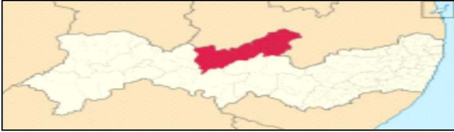
Figura 5 – Microrregião do Pajeú pernambucano

Flores, Igaraci, Ingazeira, Itapetim, Quixaba, Santa Cruz da Baixa Verde, Santa Terezinha, São José do Egito, Serra Talhada, Solidão, Tabira, Triunfo e Tuparetama, conforme figura 5: