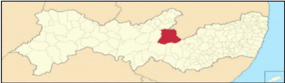
Figura 7 – Atual território do município de Sertânia no Estado de Pernambuco

Fica evidente o laço afetivo de UL para com Sertânia, ele nomeou o seu lugar, identificou e o distinguiu-o dos demais, que não fosse qualquer lugar, generalizado e homogêneo, mas o seu lugar, único e diferente, com sua serra, vegetação, seu rio, seus povoados, seus caminhos, suas histórias e seu povo, com suas cores, seus sons, percepções e atitudes que lhe atribuem valores, sentidos e significados, “o novo nome adapta-se muito bem à cidade e ao município, que, em plena zona sertaneja, limitava-se a poucas léguas com o de Pesqueira – região do agreste” (ALBUQUERQUE, 1971, p. 47). Sertânia está localizado região do Rio Moxotó, limitando-se geograficamente, ao norte, com os municípios de Iguaracy e Estado da Paraíba, ao sul, com Ibimirim, Arcoverde, Tupanatinga e Buíque, a leste com o Estado da Paraíba e, a oeste, com Custódia, a área municipal ocupa 2359 km 2 , conforme figura abaixo: