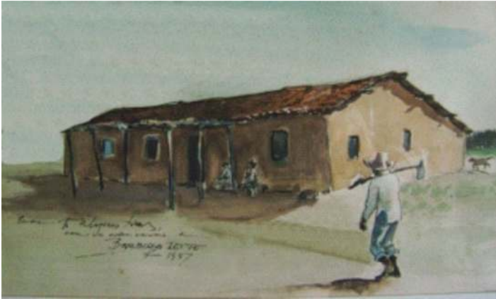
Figura 6 – Pintura da antiga casa sede da Fazenda Pantaleão