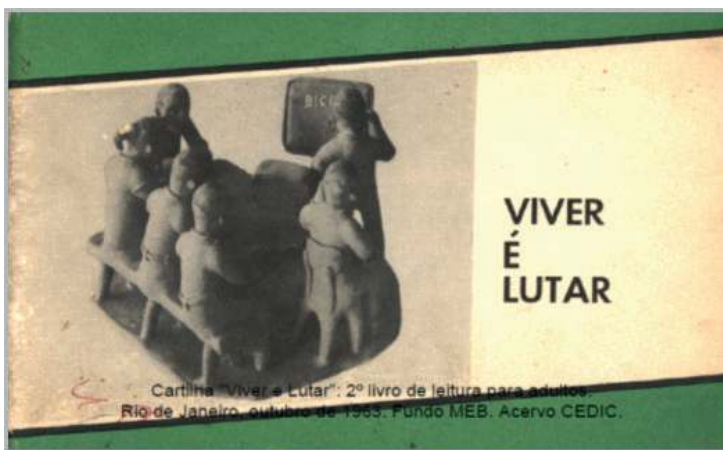
Imagem 1 – capa cartilha Viver é Lutar (1963)

Em sua capa, há uma representação de uma imagem da escola radiofônica esculpida na argila, a qual demonstra o rádio em cima da mesa e alunos ao seu redor escutando as orientações transmitidas pelo aparelho, enquanto há também um outro aluno ou monitor escrevendo sob o quadro. Os bonecos em argila é um artesanato que fazem parte da cultura estética de muitas regiões do nordeste do Brasil, como em Pernambuco, em específico a cidade de Caruaru que segue a tradição de representar a realidade por meio dessa arte.