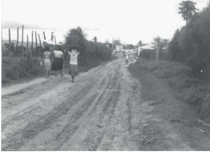
Figura 4: As mulheres/lavadeiras em direção à “rua” (cidade) em 1966