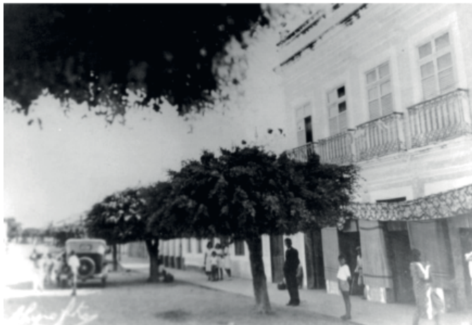
Figura 2: Os sinais do aburguesamento no centro da cidade na década de 1950