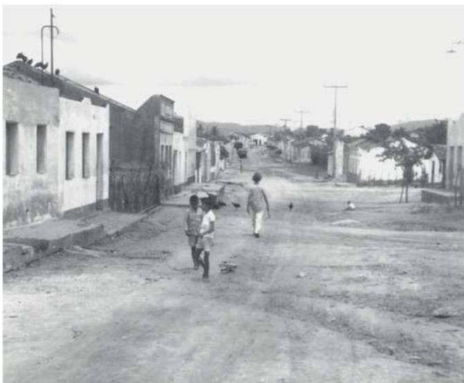
Figura 3: O abraço iconográfico entre rural e urbano no ano de 1966