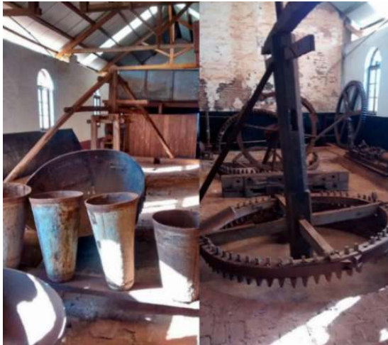
Figura 7: Formas pão de açúcar e engrenagem de Engenho de Banguê adquiridas em Pernambuco, hoje no Museu da Cana.

Entre gerações passadas, presentes, futuras, se trabalhado com absoluta coragem, ainda, este museu poderá alavancar para o futuro a memória do IAA e do Próalcool, tornando-se parte fundamental do complexo museológico do estado de São Paulo. Um centro de tecnologias inclusive culturais. Um lugar onde a consciência atinge níveis de ação e racionalidade capazes de unir a coragem, o coração, a consciência e a vocação de migrar a história do presente para o futuro. E este museu é uma saga do futuro. Como a força do amor e a força de quem ama e é por esta força capaz de transformar a si e o Outro e lutar até o fim por aquilo que acredita. Capaz a ponto de tornar o amor quase uma desobediência civil. O amor que é a energia motriz da criatividade humana. A raiz das relações sociais e seu equilíbrio. De repente, o olhar que une os sentidos exemplificados entre gerações. Uma vez mais, a força humana se une de modo quântico para multiplicar potenciais infinitos. E nasce uma primeira leitura da predestinação coletiva de um museu que pertence ao futuro e não ao passado.