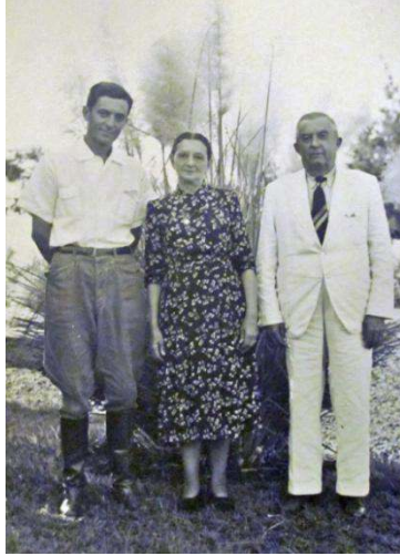
Figura 6: Família Biagi.