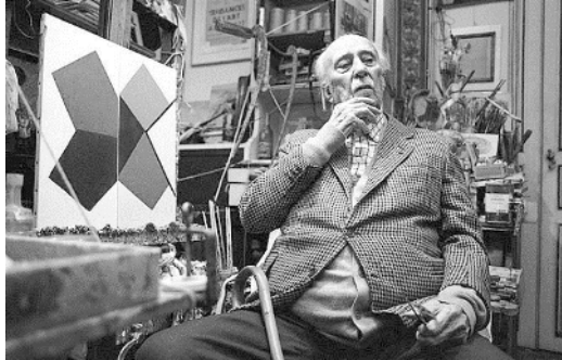
Figura 2: O pintor Cícero Dias em seu ateliê.

3