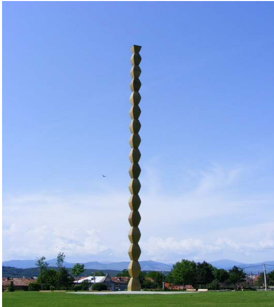
Figura 1: A coluna infinita de Brancusi.

Pode-se dizer que a obra representa a história da linguagem da escultura em diversas dimensões do espaço e do tempo e da linguagem escultórica. Nova e antiga, ela revoluciona a modernidade da escultura moderna sem nenhum traço de renovação técnica com relação à era da escultura clássica. Simplesmente, Coluna Infinita avança para o alto, de modo incomum a relação peso-equilíbrio, qualidade que define, por excelência, a linguagem da escultura. Um patrimônio material e altamente imaterial, ao mesmo tempo, resgatando os séculos anteriores da arte de esculpir, torna-se moderno apenas por avançar o limite da escultura clássica para a modernidade, diferindo a plástica da emoção, por exemplo, de Rodin e toda a emoção representativa. Diferente, Constantin Brancusi vai no cerne da afetividade humana e a sintetiza de todos os rebuscamentos.