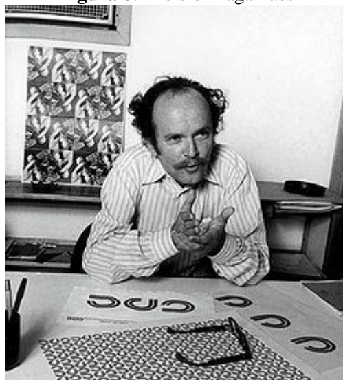
Figura 8: Aloisio Magalhães

interativo, como o da Língua Portuguesa, mas com caras, informações de pessoas, de genealogia. Não deu certo, Niemeyer não levou adiante, não apresentou o trabalho. A ideia do museu no Engenho Central estava totalmente desativada, mas em 2006, eu reativei o projeto no Ministério da Cultura. A ideia de fazer, olhando o meu avô, meu pai, e me olhando, a vontade de fazer alguma coisa, não de ser dono, de ter, ou de enriquecer, mas fazer, mesmo que passasse depois para outras mãos. Enfim, todas as empresas constituídas são operativas hoje, no horizonte de 100 anos, todas estão funcionando, nenhuma fechou. Talvez o mérito maior da família tenha sido a vontade de empreender, que vem do sangue italiano e da extrema pobreza de que eles vieram da Itália. (BIAGI, L., 2015)