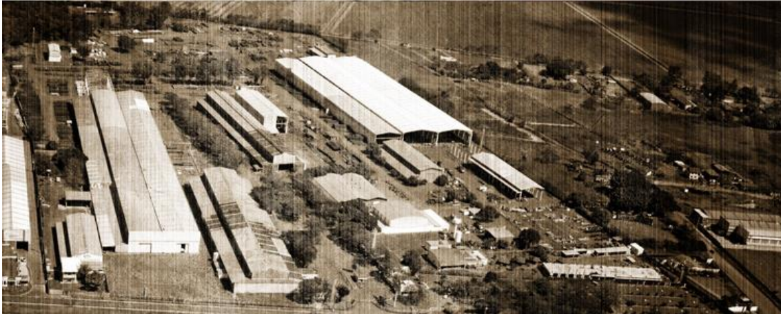
Figura 5: Instalações da Zanini S.A, fundada por Maurílio Biagi

entre os movimentos da arte internacional. E é justamente desta força da Arte Moderna brasileira que nasce o paralelo que agora deve ser percebido com a mentalidade de um pioneiro como Maurílio Biagi. Um dos desafios da modernidade era justamente a autonomia.