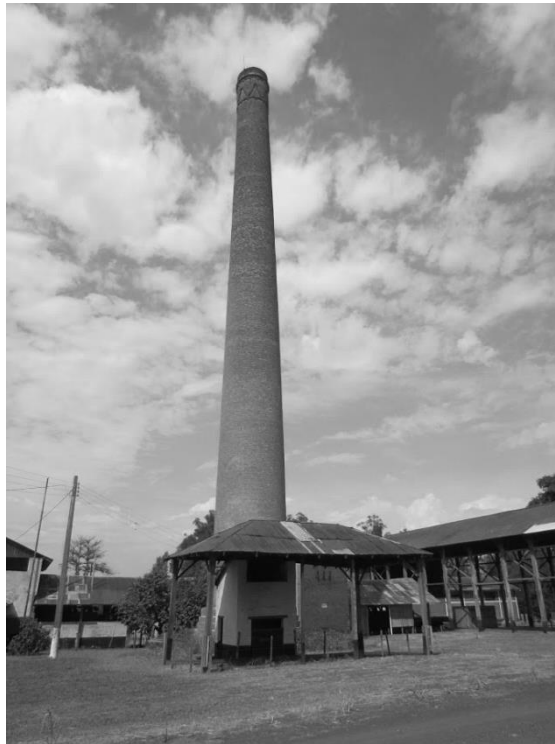
Figura 3: Chaminé do Engenho Central