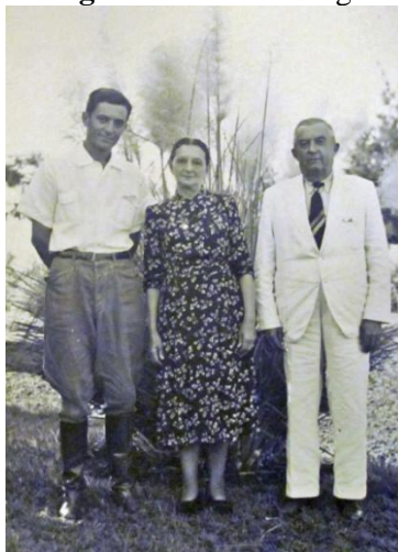
Figura 6: Família Biagi

Ninguém quer mais encontrar as cenas vivas de retirantes congeladas na atual realidade brasileira dos dias de hoje. Aqui, o amor se transcende para a consciência.