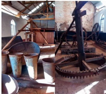
Figura 7: Formas pão de açúcar e engrenagem de Engenho de Bangué adquiridas em Pernambuco, hoje no Museu da Cana.

Entre gerações passadas, presentes, futuras, se trabalhado com absoluta coragem, ainda, este museu poderá alavancar para o futuro a memória do IAA e do Próalcool, tornando-se parte fundamental do complexo museológico do estado de São Paulo. Um centro de tecnologias inclusive culturais. Um lugar onde a consciência atinge níveis de ação e racionalidade capazes de unir a coragem, o coração, a consciência e a vocação de migrar a história do presente para o futuro. E este museu é uma saga do futuro. Como a força do amor e a força de quem ama e é por esta força capaz de transformar a si e o Outro e lutar até o fim por aquilo que acredita. Capaz a ponto de tornar o amor quase uma desobediência civil. O amor que é a energia motriz da criatividade humana. A raiz das relações sociais e seu equilíbrio. De repente, o olhar que une os sentidos exemplificados entre gerações. Uma vez mais, a força humana se une de modo quântico para multiplicar potenciais infinitos. E nasce uma primeira leitura da predestinação coletiva de um museu que pertence ao futuro e não ao passado.