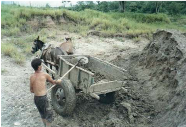
Imagem 1 – carroça e pá, usadas para transporte e carregamento de barro.

Há uma cultura material que pode ser identificada nos seus instrumentos de trabalho, no uso de técnicas próprias para a retirada da matéria-prima e sua transformação, na residência próxima ou no terreno da fábrica e no cultivo de víveres para a subsistência, entre outros aspectos. Em suma, existe tal cultura na constituição de um modo de vida no qual podem ser observadas características que foram trazidas do campo e que, a princípio, alguns de seus traços são mantidos na convivência com trabalhadores urbanos, de outros setores da economia e com a população da cidade.