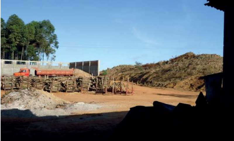
Imagem 5 – depósitos de lenha e barro em cerâmica no município de Jataizinho, Paraná, Brasil.

Data: mar. 2012.