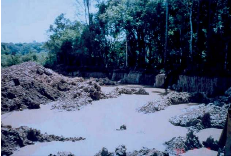
Imagem 4 – Lavra de argila no Eixo Imbituva – Prudentópolis. As cerâmicas utilizam o taguá (barro de barranco) como matéria-prima.

O documento citado aponta uma série de problemas, que os técnicos identificam como circunscritos à atividade cerâmica. No entanto não indica, nem exige a quem de direito os meios de combate, que vise a superar a situação identificada.