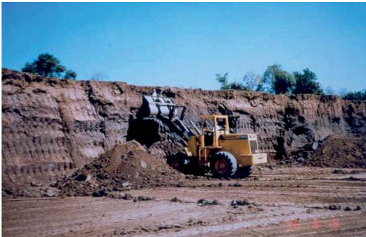
Imagem 3 – Este local funciona como “barreiro” comunitário, onde todas as olarias da região são abastecidas de matéria-prima.

Na produção de materiais de construção são emitidos poluentes aéreos, o que geram impactos como o efeito estufa, a destruição da camada de ozônio e a chuva ácida. Esses impactos estão relacionados ao transporte, ao uso de energéticos e à liberação de gases durante o processo produtivo desses materiais (MINEROPAR 2007, p. 19).