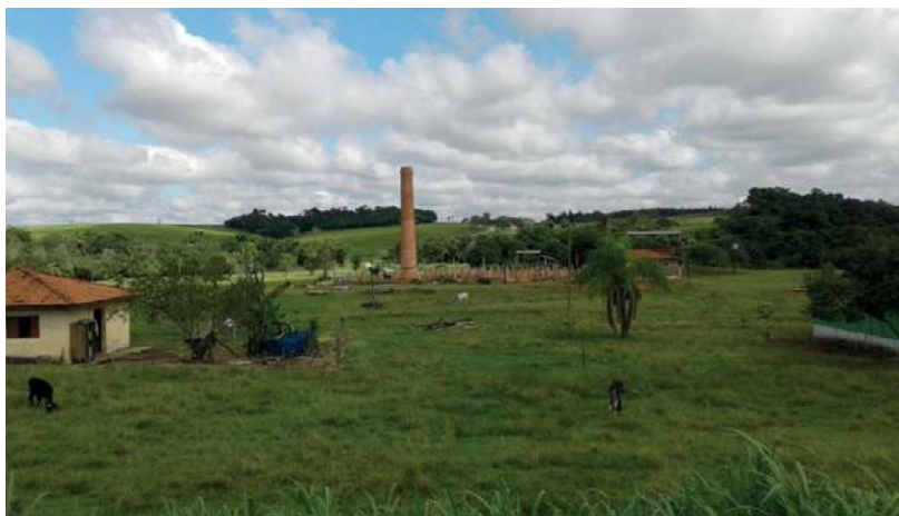
Imagem 2 – Cerâmica desmontada na BR 153, próxima ao município de Guapirama, norte do Paraná.