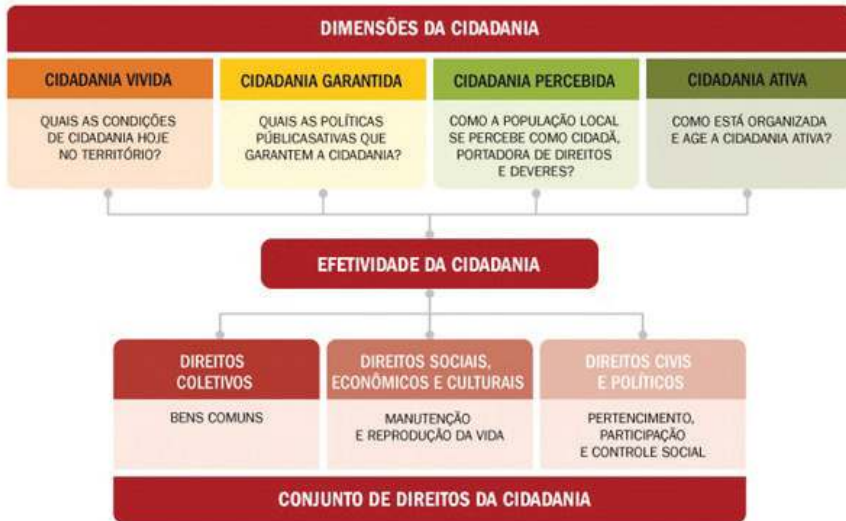
Figura 1: Visão Sintética e Integradora de Dimensões de Cidadania e de Conjuntos de Direitos de Cidadania