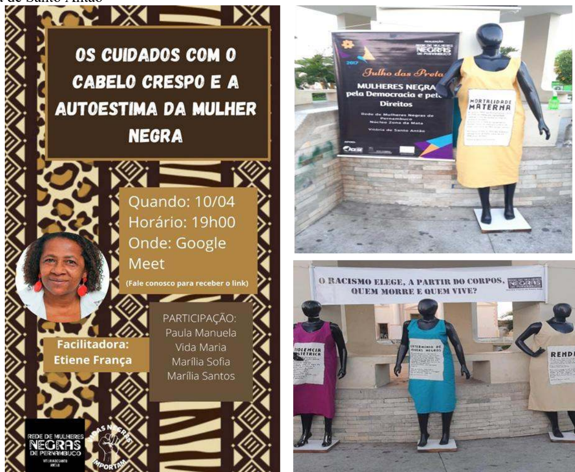
Figura 2 - Práticas realizadas pela Rede de Mulheres Negras de Pernambuco no município de Vitória de Santo Antão