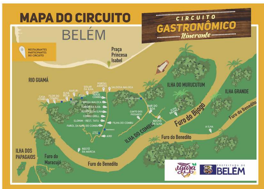
Figura 2 - Publicidade para turismo gastronômico no Combú

e comer no número crescente de bares e restaurantes durante os finais de semana e feriados. O primeiro restaurante foi aberto em 1982 e serviu aos membros do Belém Yacht Club e alguns outros, com acesso ao transporte aquático privado. Nos últimos dez anos, o aumento de restaurantes e lanchas que atendem aos turistas tem sido rápido e atualmente existem mais de vinte restaurantes na ilha. Até algumas campanhas públicas foram lançadas para promover a gastronomia local para um público mais amplo (Figura 2).